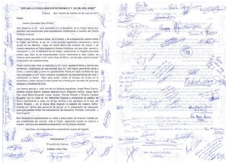
La carta por sus dos caras

que derrame sus bendiciones para agradecerle cordialmente a nombre del Centro Poblado Unanue.